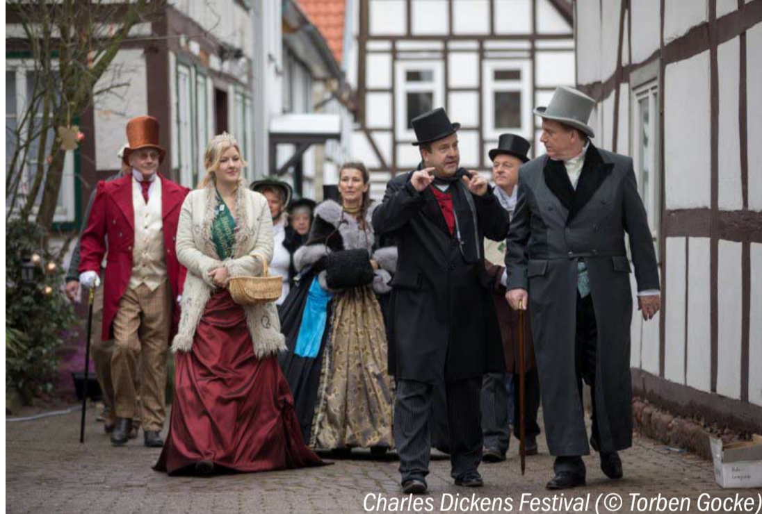
Charles Dickens Festival

17. Dezember 2017 (3. Advent) um 15.00 Uhr, Treffpunkt Lidl-Parkplatz Lemgo Fahrt zur "Charles-Dickens-Weihnacht" in Blomberg