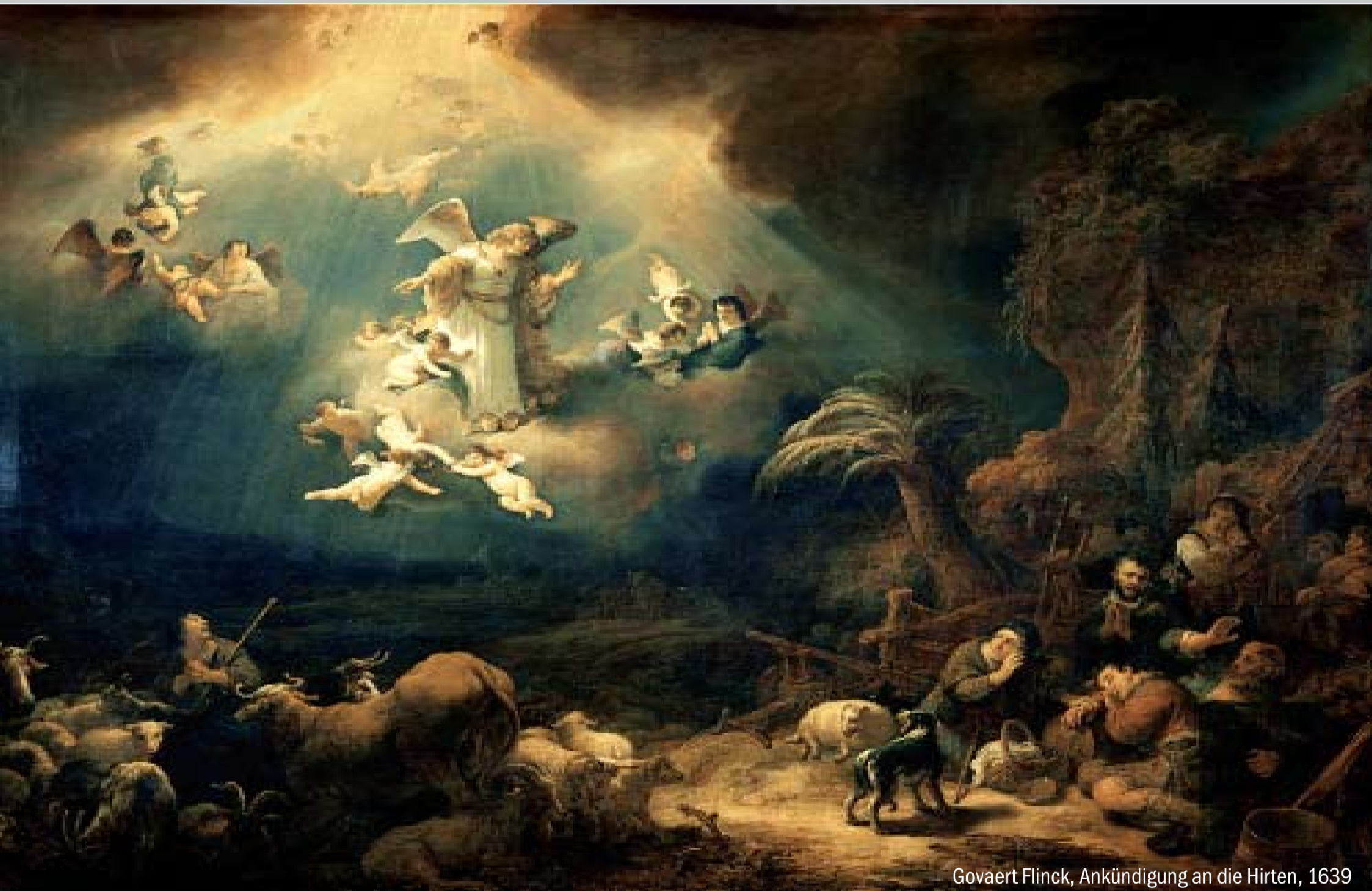
Govaert Flinck, Ankündigung an die Hirten, 1639

Allen Gemeindemitgliedern und allen Leserinnen und Lesern ein gesegnetes Weihnachtstfest und ein gesundes neues Jahr!